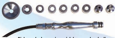
Sistema dual con microcristales y puntas de diamante

Este sistema dirige, a presión controlada, un flujo de microcristales sobre la piel, los cuales suavemente pulen la superficie envejecida y marchita. Básicamente este tratamiento induce a los mecanismos naturales de regeneración de la piel a traer las capas internas saludables hacia la superficie, mejorando notablemente su tersura. La regeneración epidérmica es lograda mediante la aplicación de una serie de cortos tratamientos de microdermoabrasión. La textura de la piel se beneficia con la formación de las nuevas células epiteliales que tienen más elastina, colágeno y mayor circulación sanguínea. La microdermoabrasión reduce sustancialmente las irregularidades cutáneas y efectos del envejecimiento ya que estimula la generación de nueva piel completamente rejuvenecida con apariencia radiante, fresca, suave, delicada y totalmente revitalizada.